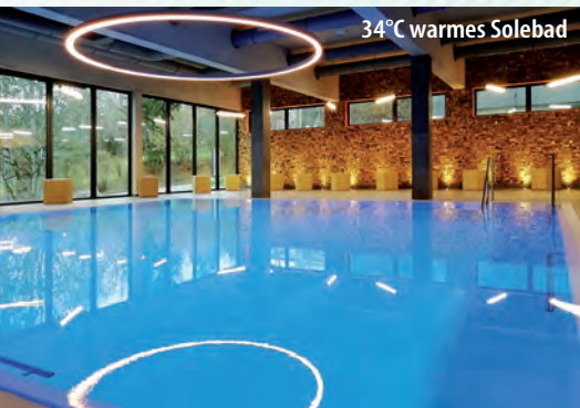
34°C warmes Solebad