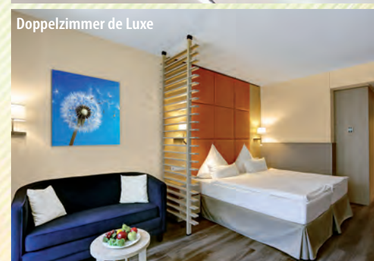
Doppelzimmer de Luxe