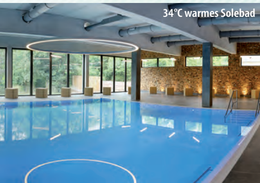
34°C warmes Solebad