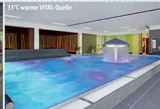
33°C warme VITAL-Quelle