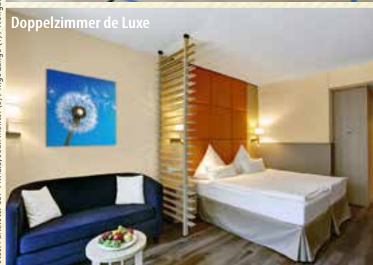
Doppelzimmer de Luxe