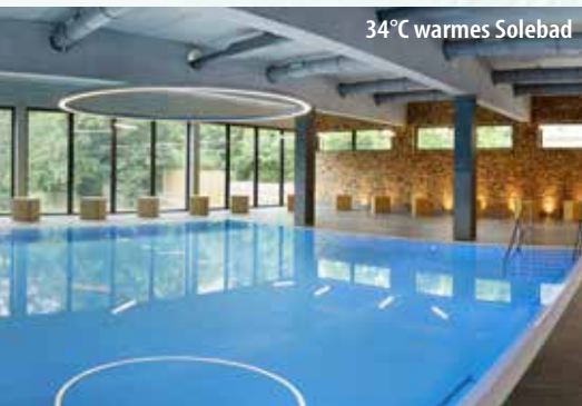
34°C warmes Solebad