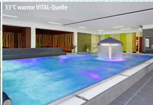
33°C warme VITAL-Quelle