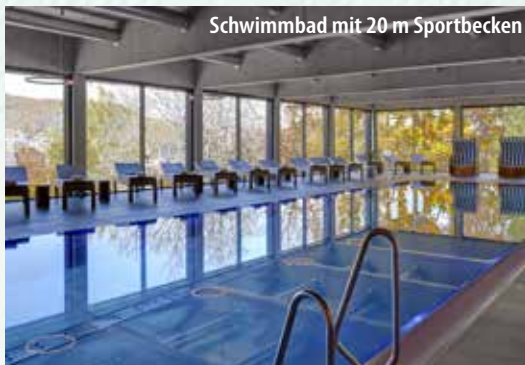
Schwimmbad mit 20 m Sportbecken