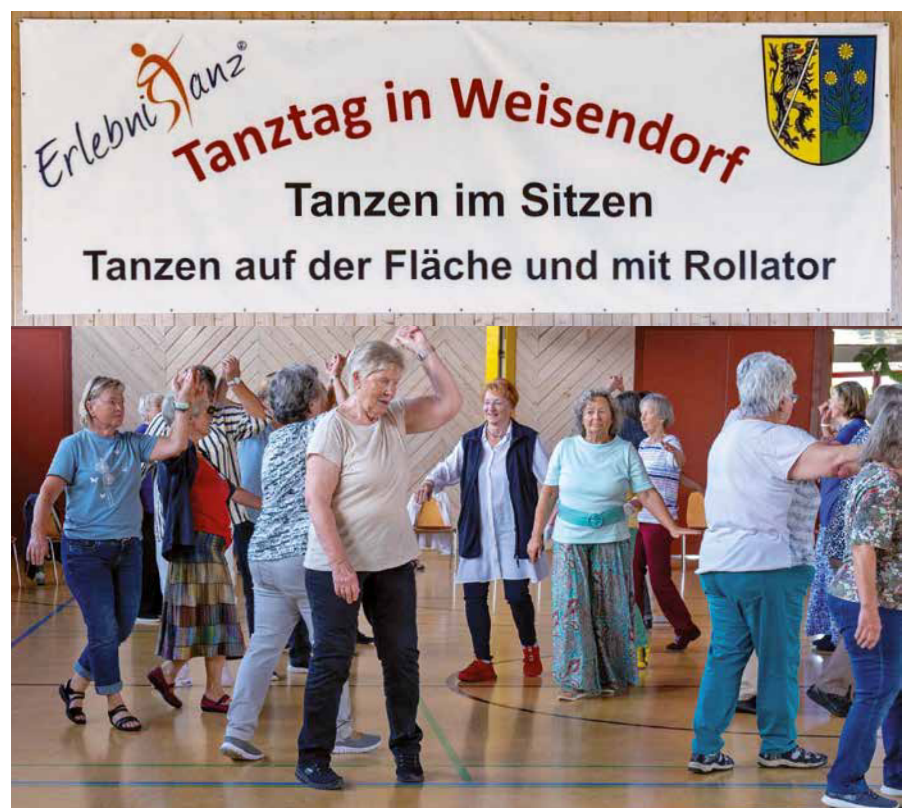
Vielfalt und Lebensfreude vermitteln die Tänze beim Tanztag in Weisendorf ...