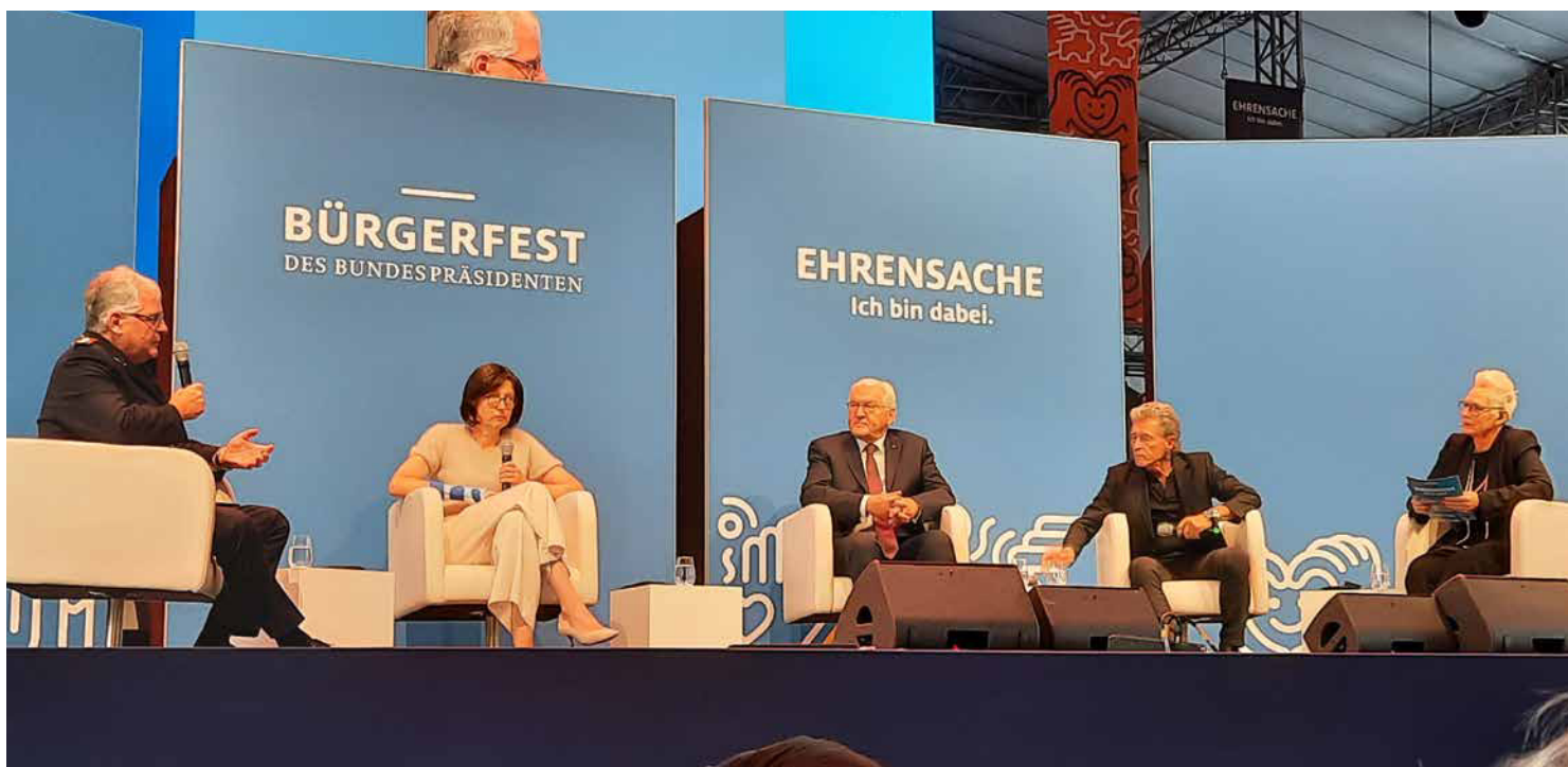
Podiumsdiskussion beim Bürgerfest mit dem Bundespräsidenten Walter Steinmeier.