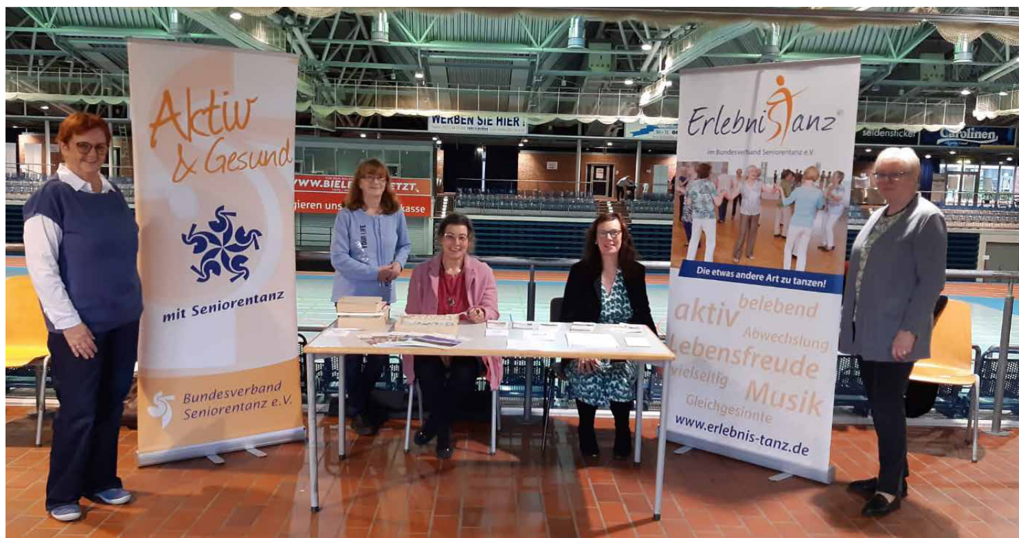
Präsentation des ErlebniSTanzes am Stand des BVST am „Tag der Mobilität“ in der Seidenstickerhalle Bielefeld.

Bedürfnisse älterer Menschen im Fokus in der Seidenstickerhalle Bielefeld