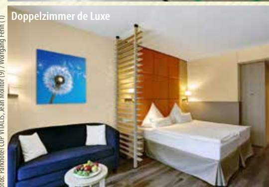
Doppelzimmer de Luxe

Veranstalter: CUP Touristic GmbH, Marcusallee 7a, 28359 Bremen, Tel. 0421-20 36 00