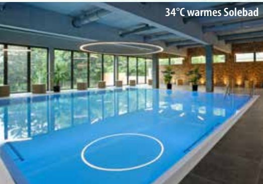
34°C warmes Solebad